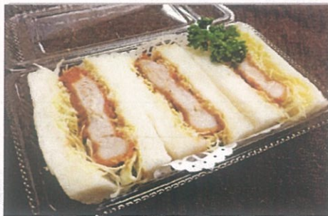
JGM特製カツサンド ¥600(税込)