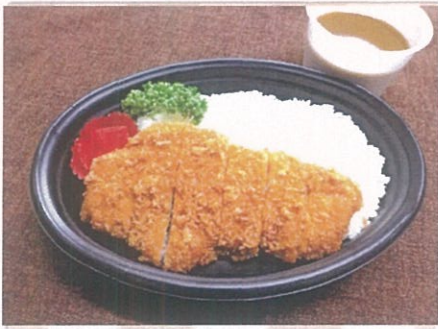
JGM特製カツカレー(甘口・中辛) ¥900(税込)大盛りプラス¥100