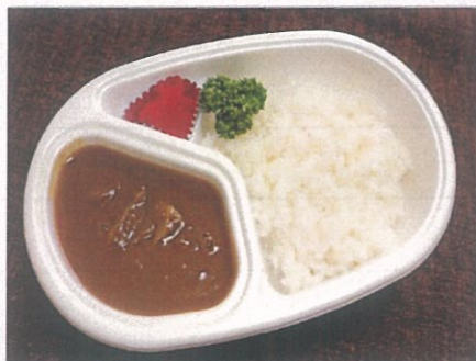
JGM特製ビーフカレー(甘口・中辛) ¥600(税込)大盛りプラス¥100