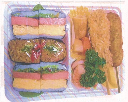
おにぎらず弁当(大) ¥1,000(税込)