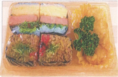
おにぎらず弁当(小) ¥600(税込)