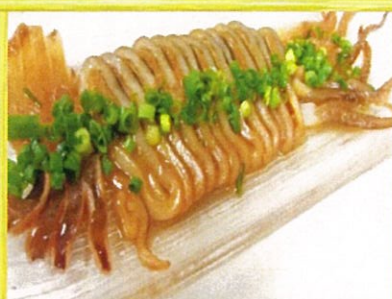
真イカの沖漬け 720円