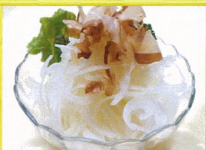
オニオンライス 470円