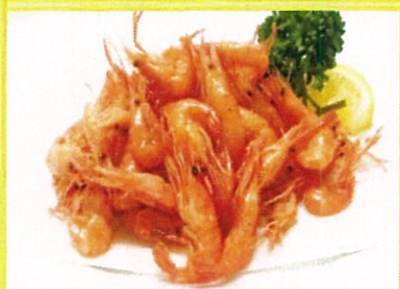
川海老の唐揚げ 540円