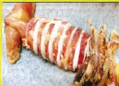
イカのぼっぼ揚げ 1,090円