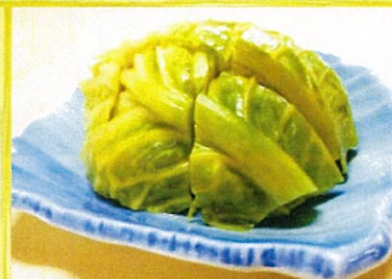
キャベツの浅漬け 500円