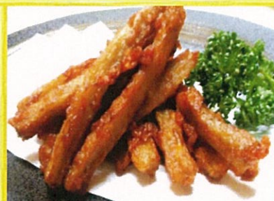
ごぼうの唐揚げ 570円