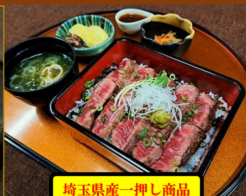
埼玉県産一押し商品