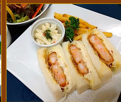
JGM特製エビカツサンド

(お新香・御飯・味噌汁付) 御飯大盛 プラス ¥100 ¥1,700(税込) ※食事付プランの場合 プラス ¥40 頂戴いたします