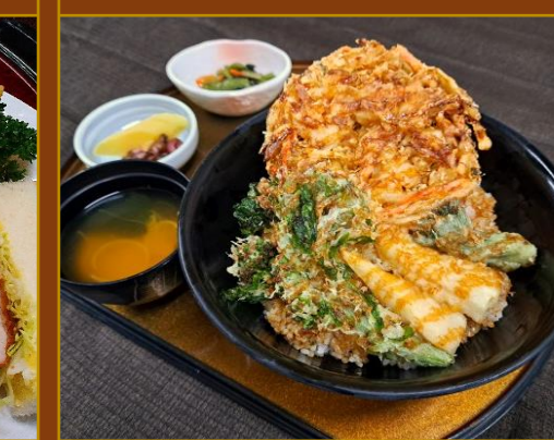
桜エビのかき揚げ丼

(サラダ・スープ・デザート付) ¥1,660(税込) ※食事付プランの場合 ¥0