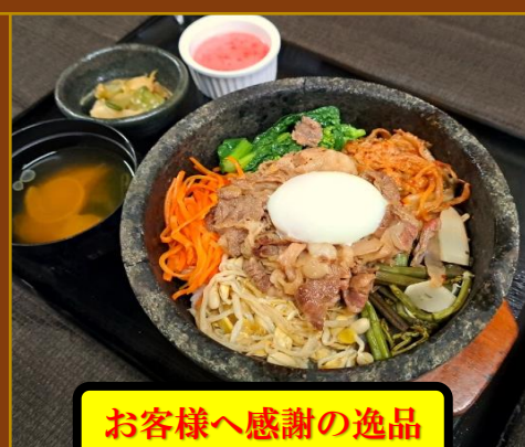
お客様へ感謝の逸品

御注文の内容、スタート時間により、他のお客様とご提供が 前後してしまう場合がございます。予めご了承下さい。