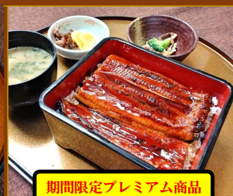
期間限定プレミアム商品