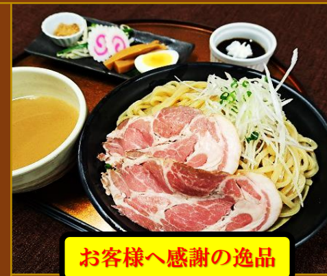
お客様へ感謝の逸品