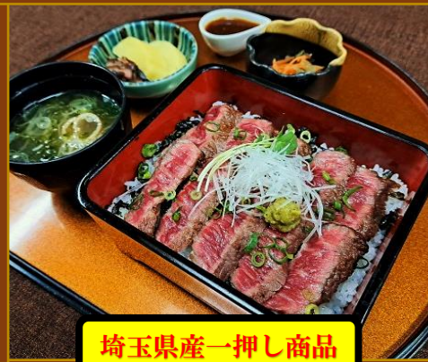
埼玉県産一押し商品