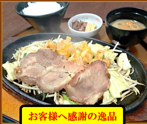
お客様へ感謝の逸品

御注文の内容、スタート時間により、他のお客様とご提供が 前後してしまう場合がございます。予めご了承下さい。